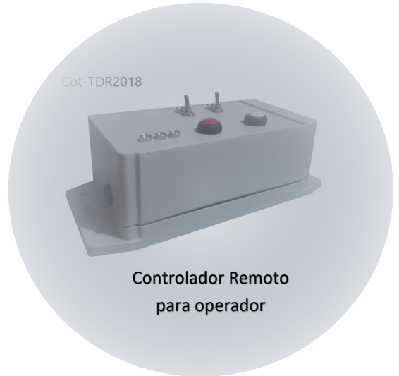
Controlador Remoto para operador

Pensamos en el Técnico Nebulizador y todos los actores clave del control de vectores, desde el proceso de supervisión hasta el proceso de evaluación de impacto.