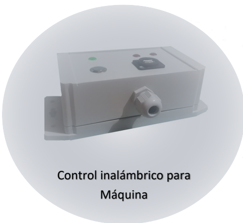
Control inalámbrico para Máquina